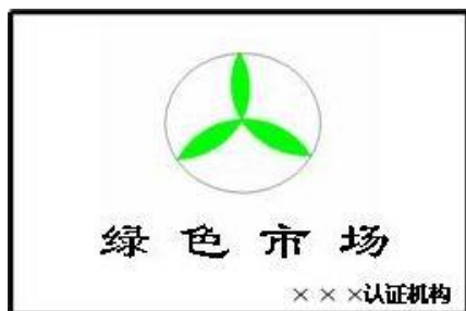
绿色市场认证标牌基本图案